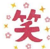
笑顔になれることをする