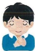
自分の気持ちを受け入れる