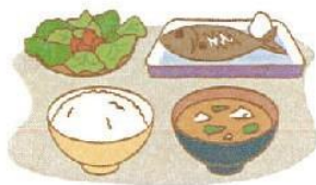
バランスのとれた食事