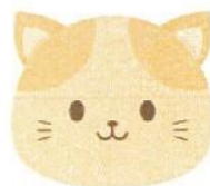
ペットと触れ合う、または 動物の癒し系動画を見る