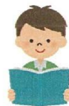
趣味など、リラックスできることをする