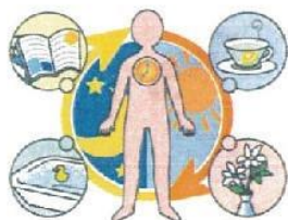
生活リズムを整えよう