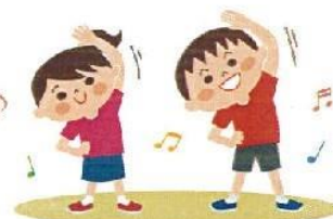
軽い運動(ラジオ体操でOK)